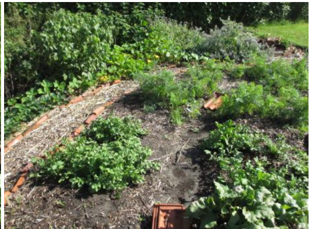
Bij de courgettes, wortels, bonen en paksoi is geen verschil waarneembaar. Hetzelfde geldt voor de peulen, terwijl hierbij vorig jaar toch duidelijk een verschil was in het voordeel van Agriton.