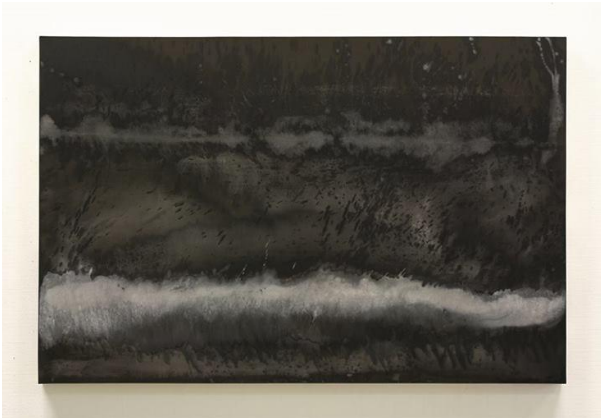
Sæ-earm Sinus (EM-kunst) KANELI & SMIT 2013

Gevierde kunstenaars Kaneli & Smit uit Groningen werken met lokale natuurlijke materialen zoals Groningse klei, zand en leem. Onderstaand schilderij is gemaakt met onder andere EM-keramiekpoeder. Voor meer beeldend werk zie www.kaneli-smit.nl .