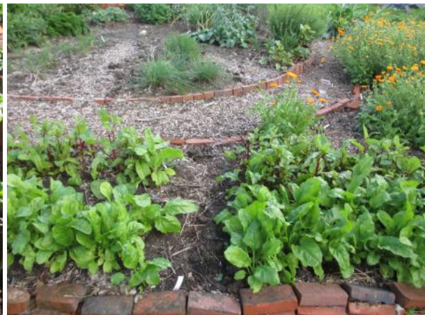
Bij de snijbieten, spinazie en ook gewone bieten lijkt Agriton juist minder goed te werken.